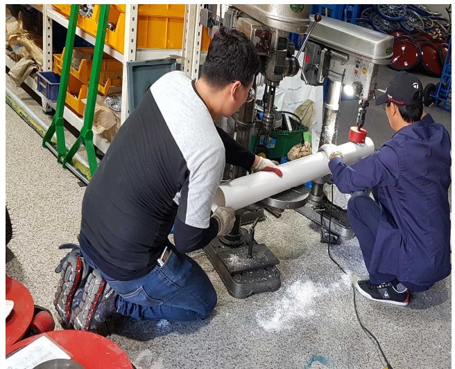
1차 시제품 제작