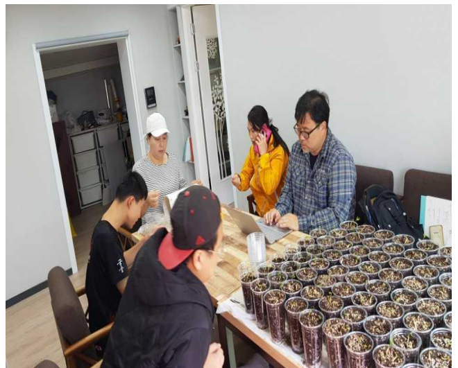
도시재생 사례 조사 및 연구모임