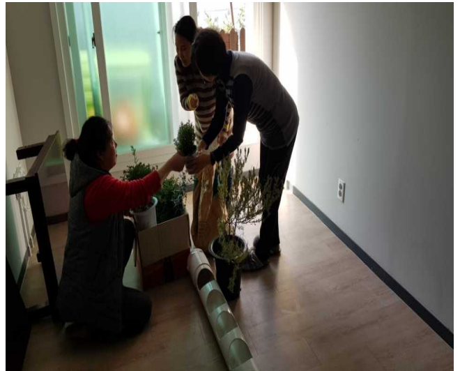
원예전문가의 자문 및 1차 디자인 후 식물 분류 및 파이프에 식재